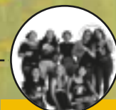
COLECTIVA AMORALES El Salvador

MODA INFANTIL ANA BELÉN Justo Martínez, 10